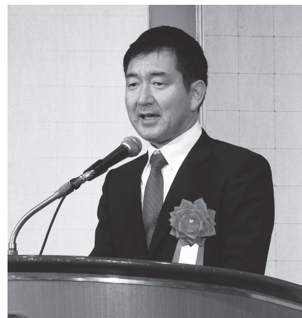
前衆議院議員柳本顕氏