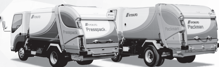
プレス式ごみ収集車 PRESSPACK.

洗練されたデザインとひとつ先をゆく作業性で現場の期待に応えるカタチへ進化しました。