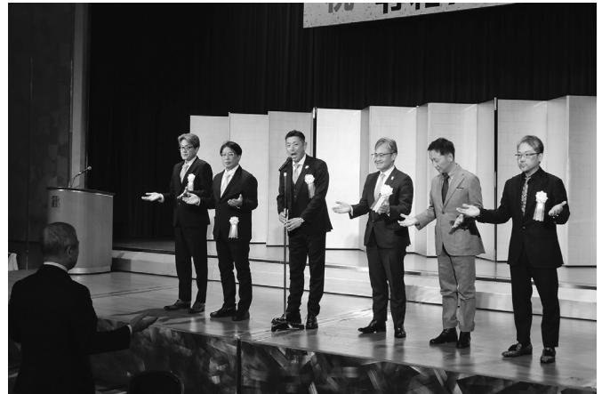
会を締めくくる大阪締め