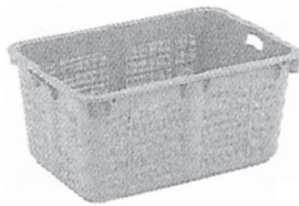
プラスチックカゴ 各種