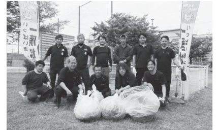
大正区鶴町南公園