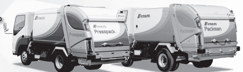
プレス式ごみ収集車 PRESSPACK.

洗練されたデザインとひとつ先をゆく作業性で 現場の期待に応えるカタチへ進化しました。