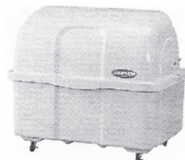
ジャンボペール 各種