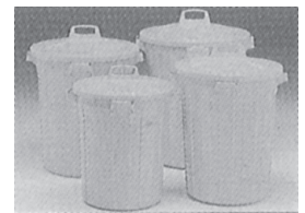
G K 容器 各種