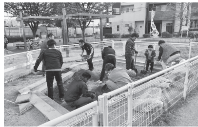
鶴見区焼野南公園