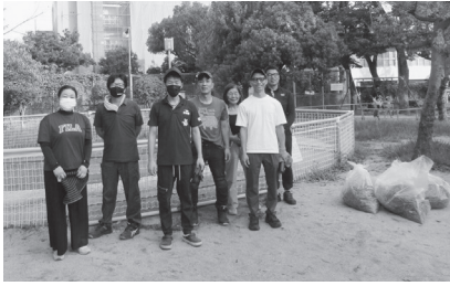
阿倍野区晴明丘中央公園

一廃協青年部は11月25日(土)14時から鶴見区焼野南公園において総勢10名参加のもと砂場清掃を行いました。当日は少し肌寒い天候でしたが、たくさんの子ども達で公園はいっぱいでした。砂場清掃を始めると子供たちが興味津々で作業を見守っていました。